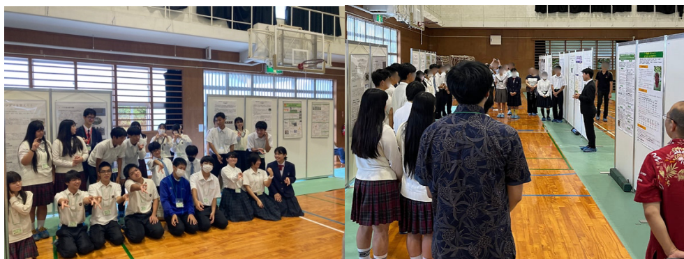
参加した高校生たちの記念撮影

昨年の令和6年11月3日に初開催された日本園芸学会「高校生ポスター発表会」について参加者、関係者から好評をいただいたため、本年度から沖縄で継続的に開催すること運びとなりました。理系離れが進む状況で、「農学/生物学」の分野に関心を持つ高校生を増やしていくことは、将来の農業分野の担い手不足や地域農業振興につながると期待されます。特に「農学」の分野はまだ中高生の進路決定において、どのような学問分野なのか理解されておらず、潜在的にミスマッチが生じている状況が懸念されます。そのため、高校生が大学生や大学教員、研究者と直接情報交換できる機会をつくる目的で、本会を企画しました。会場を風樹館にして展示期間を設けることにより、広くポスターを公開でき、来場者からコメントをいただける工夫をします。このような機会を通して、そのような参加者の中から、農学や生物学に関する関心や問題意識を持って本学を選んで進学する高校生が一人でも増えることで、大学入学後の周囲の学生に良い影響を及ぼすのではないかと考えています。そのため1月17日、18日にある大学共通テストの直後であることから、進路決定に悩んでいる高校生が大学を訪れる機会にもなると期待しています。市民公開シンポジウム「農学は明日の沖縄のみどりをまもる」（植物防疫所職員・琉大教員・農学部学生（ちゅらプロ）の講話）を併せて開催します。