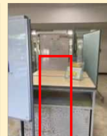
共通教育棟1号館出入口