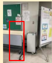
共通教育棟2号館2階 フリースペース