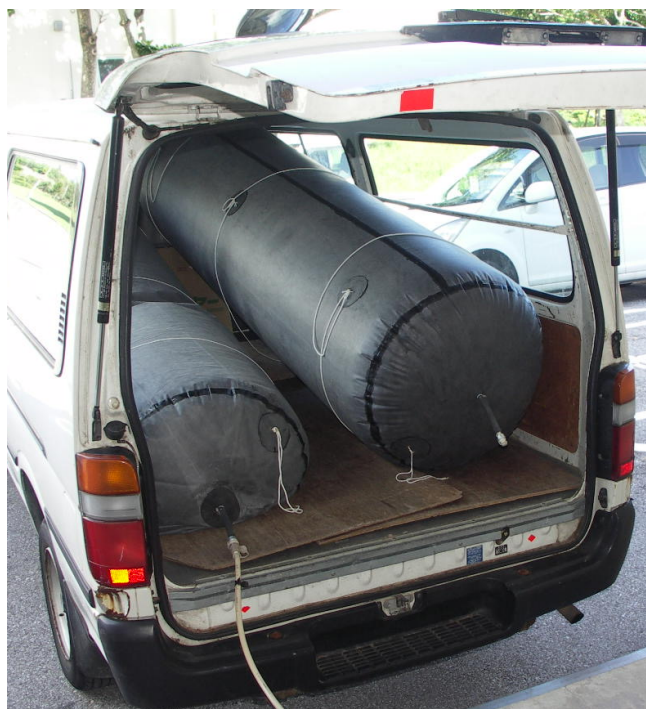
ガスバッグ 大気圧で一時貯蔵