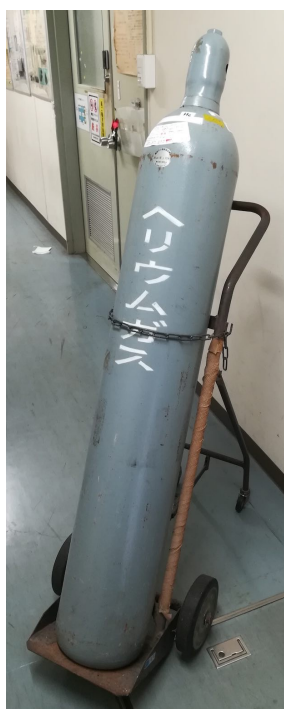
高圧ボンベ 150気圧に圧縮