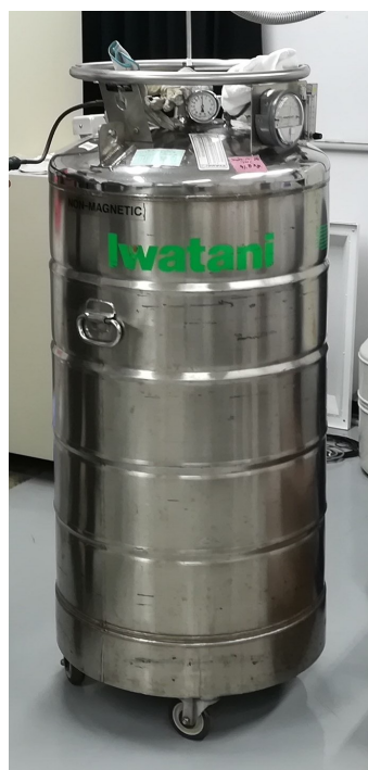
液体ヘリウム -269^{\circ}\text{C} 断熱容器