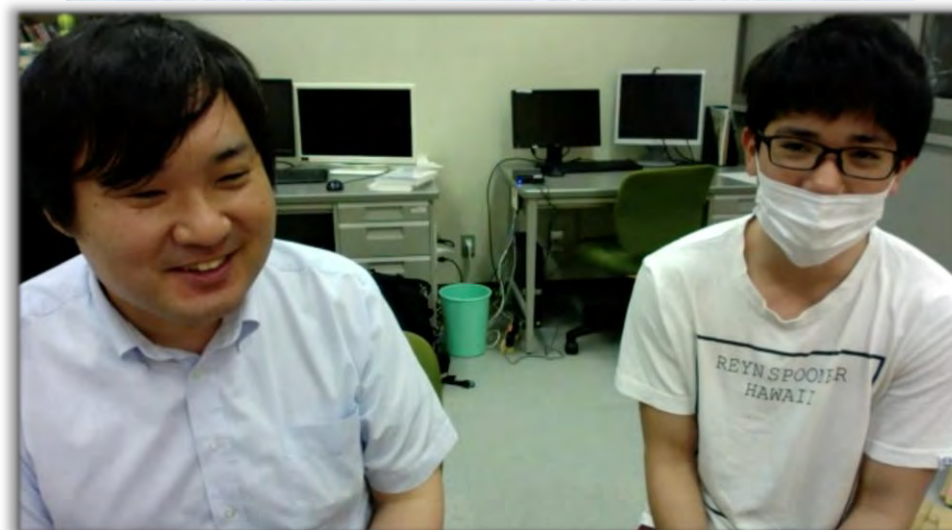
講義（オンライン配信）のようす