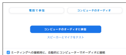
オーディオ接続確認画面

[電話で参加]は選択しないでください(国際電話料金が発生してしまう場合があります)。