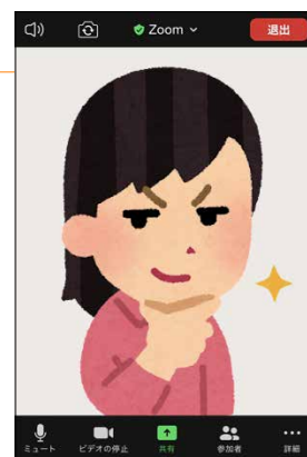
ミーティングテスト画面

10. テストが完了したら、 [退出] → [会議を退出] をタップしてアプリを終了します。