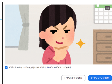
ビデオプレビュー画面

本名でもニックネームでも構いませんがここで入力した名前はプログラムを実施する教員や職員、その他の参加者にも見えますのでご注意ください。