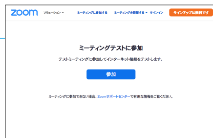
ミーティングテスト(TOP画面)

[参加]を押してもアプリのインストールが開始されない場合は、画面下部の[Zoomをダウンロードして実行してください]のリンクを押すとインストールが始まります。