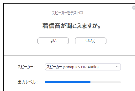
スピーカーテスト画面