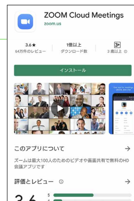
Google Play (Zoomのダウンロード画面)