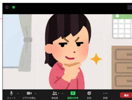
ミーティングテスト画面