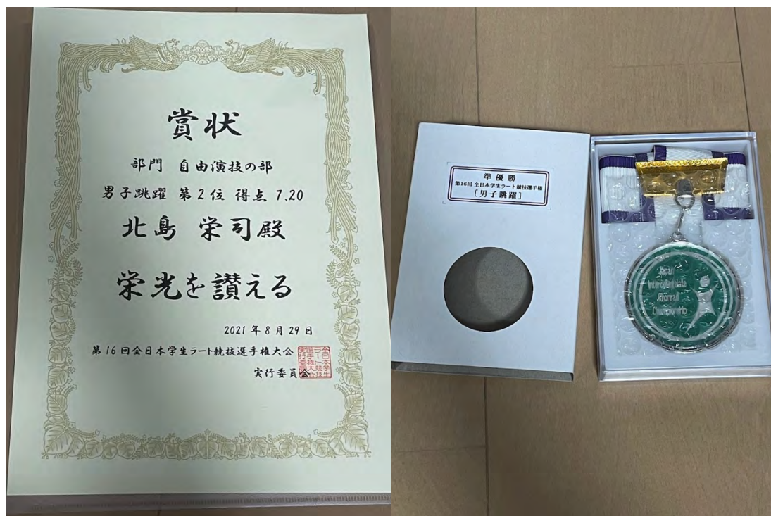
図5:贈呈された賞状と銀メダル。実行委員会の方々、ありがとうございました！