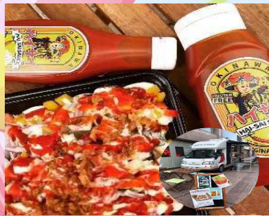
② ティーダキッチン