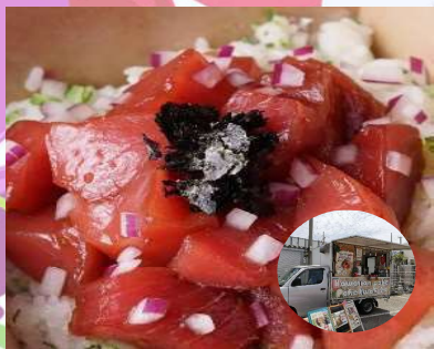
⑤ HAWAIIAN POKE39