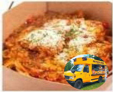
① アイルパスタラバース