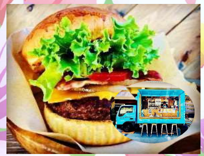
⑥ バーガー サニー