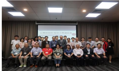
【台湾協定校・琉球大学連絡会】