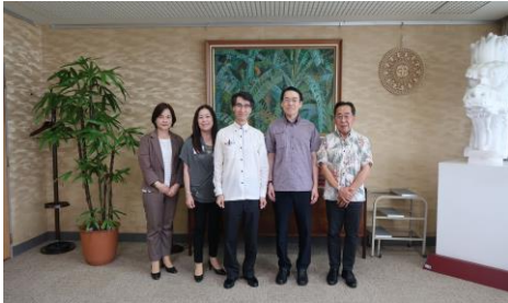
【表敬訪問】台北駐在日経済代表処那覇分処長と