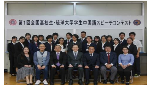
【第1回全国高校生・琉球大学学生中国語スピーチコンテスト】