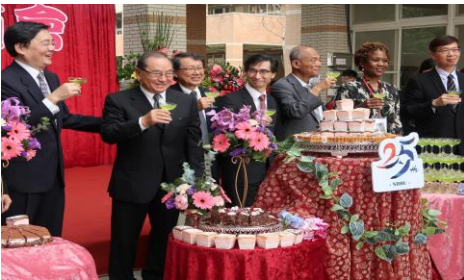
【国立東華大学創立25周年記念会式典】