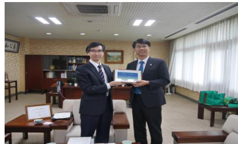
【表敬訪問】逢甲大学長と