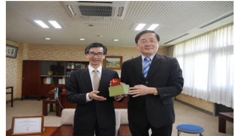
【表敬訪問】国立東華大学長と