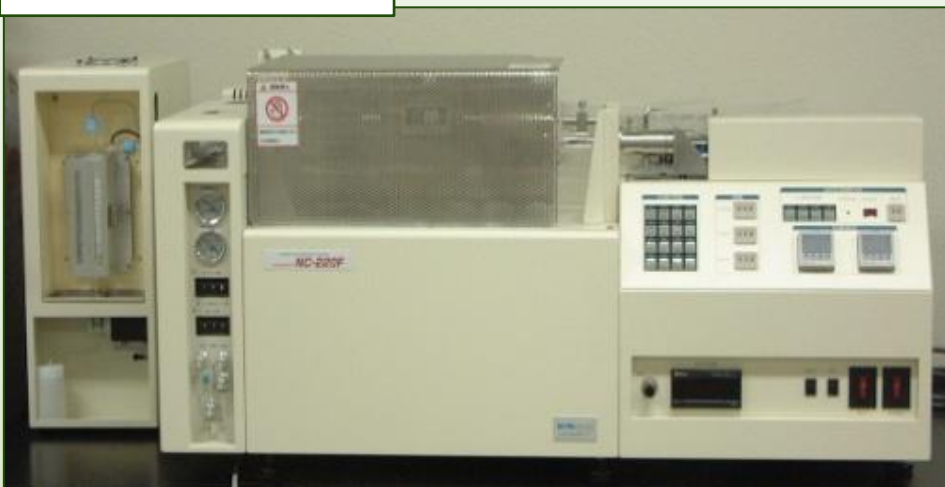
SUMIGRAPH NC-220F (株式会社住化分析センター)