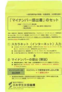
②マイナンバー提出書類