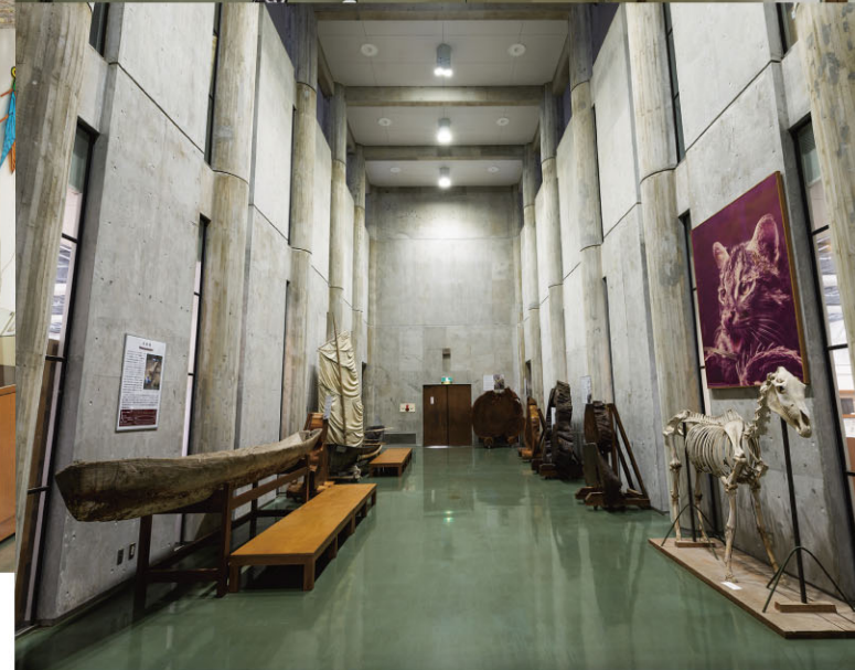
上段は文化系展示室、中段下段は自然系展示室