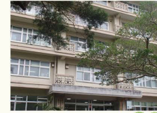
C 共通教育棟 (グローバル教育支援機構)