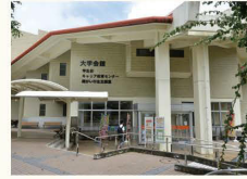
B 全保連ステーション (大学会館) (キャリア教育センター・入試課)