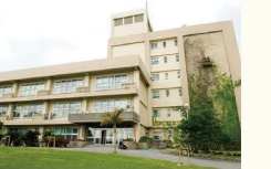
D 人文社会学部 D 国際地域創造学部